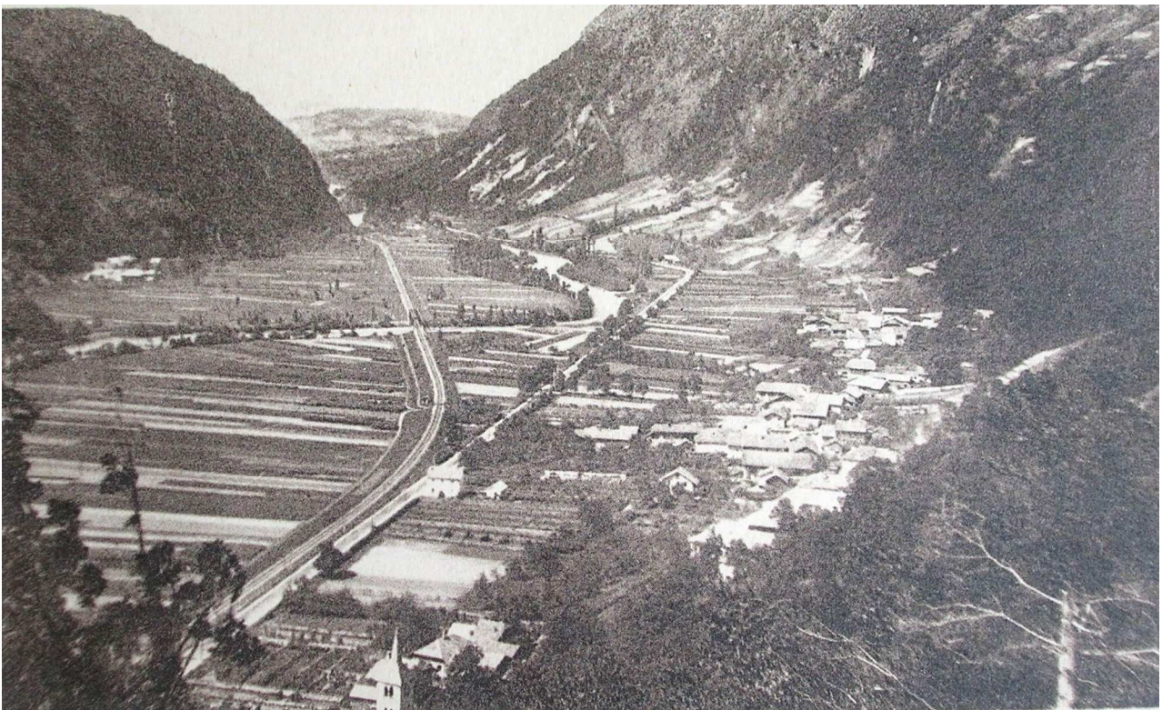
Vue de Feissons