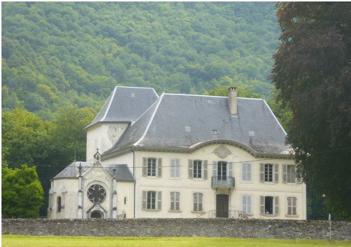
Château de Tours en Savoie, demeure des Rosset de Tours