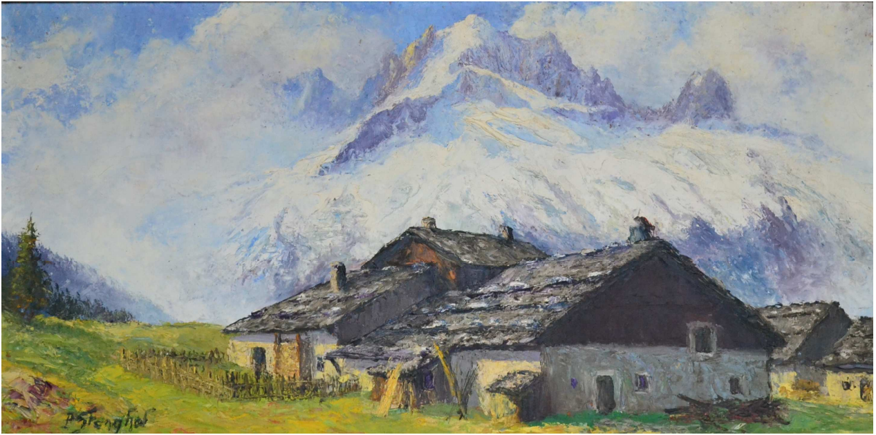
Vue de l'aiguille verte et de l'aiguille du Dru depuis le col du Montet (P. Stenghel)