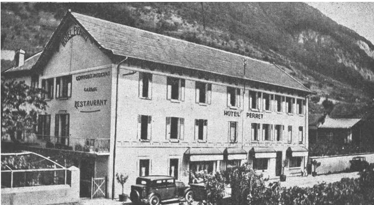
Hôtel Perret à Aigueblanche

Les Perret d'Aigueblanche et de Bellecombe sont très probablement originaires de Villargerel, où l'on trouve une famille de ce nom en 1561. Etablis à Aigueblanche au début du XVII e siècle, ils se sont distingués au plan local pour avoir été une florissante lignée de maréchaux et de forgerons. A la fin du XIX e siècle et durant tout le siècle suivant, leur nom s'est illustré d'une autre manière, grâce à un hôtel renommé, bien situé à la sortie de la ville, au bord de l'ancienne grande voie qui conduisait à Moûtiers.