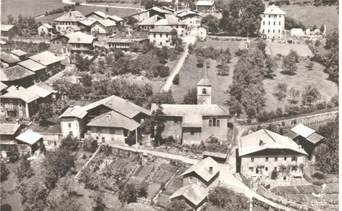
Grand-Cœur, le chef-lieu