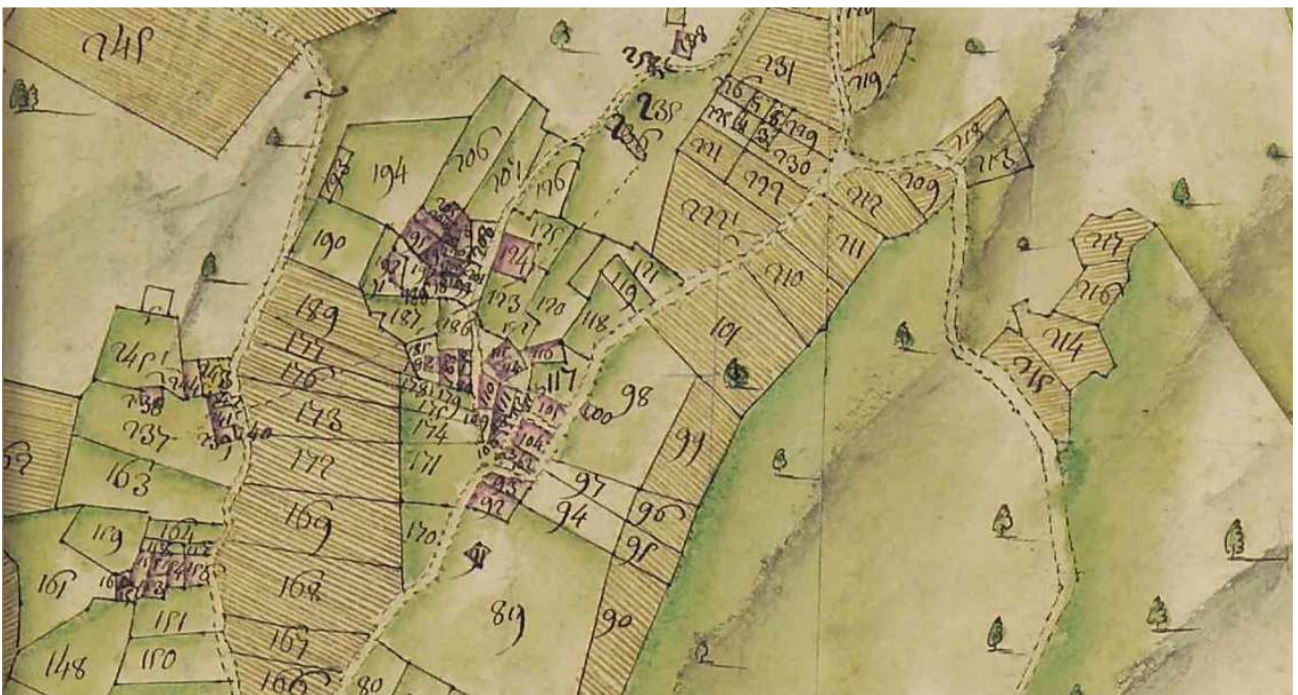
Mappe du duché de Savoie, paroisse de Notre-Dame-de-Briançon, le village du Cudray