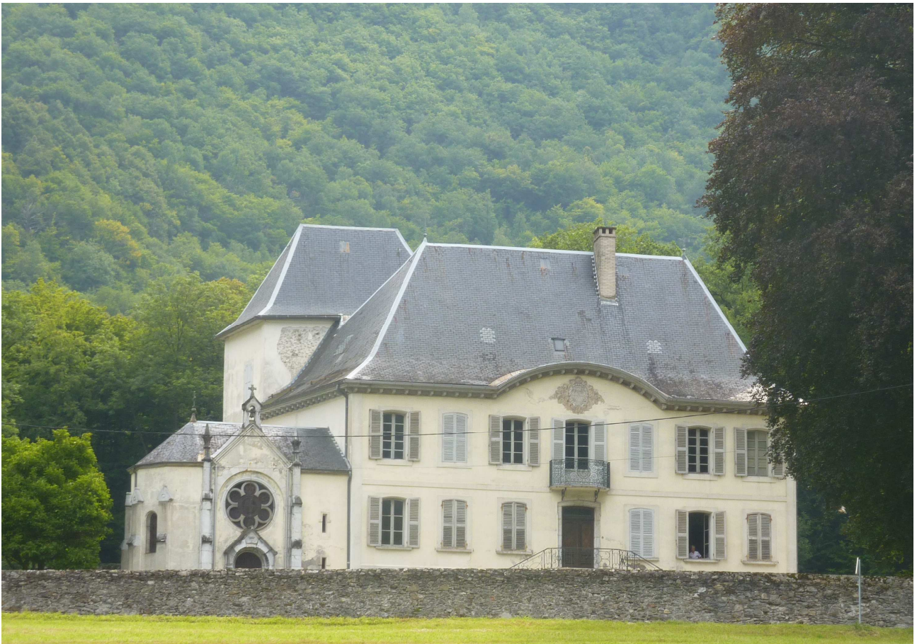
Château de Tours en Savoie, demeure des Rosset de Tours